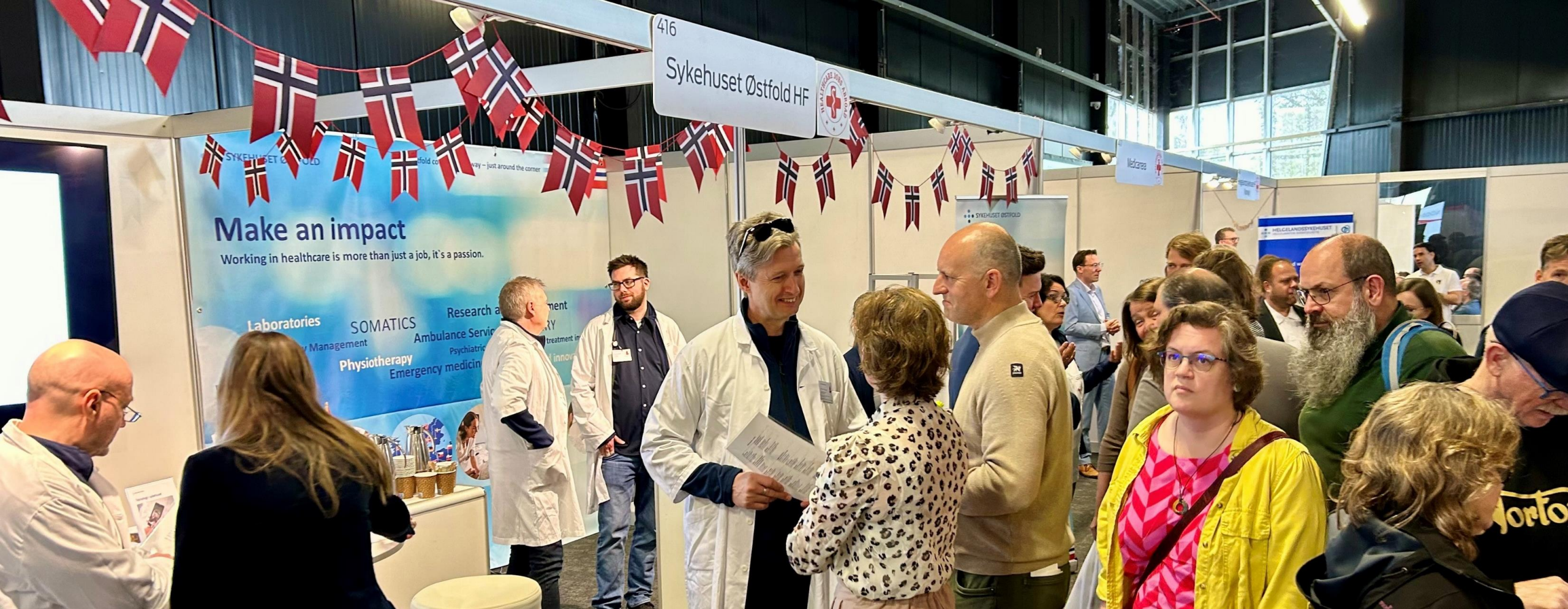
Norske sykehus på stand