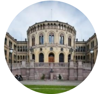
7. Politiske trender